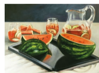
„Erfrischend“, Öl auf Leinwand